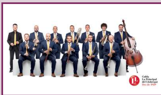
LA PRINCIPAL DEL LLOBREGAT