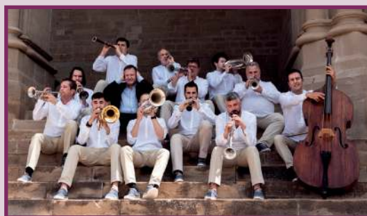
LA PRINCIPAL DE LA BISBAL